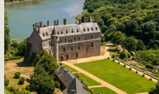
La Roche-Jagu Ploëzal À 20 minutes