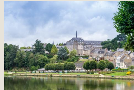
Son château et ses jardins Quintin À 15 minutes