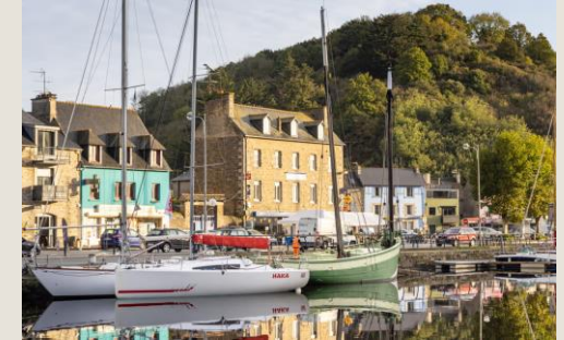
Le port du Légué St-Brieuc À 10 minutes