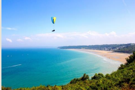
La Baie de Saint-Brieuc d'Erquy à St Quay-Portrieux À 5 minutes