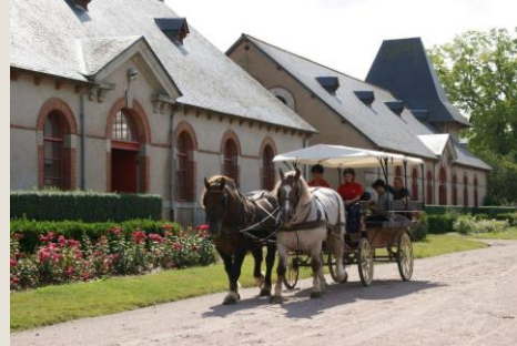
Le Haras National Lamballe À 20 minutes