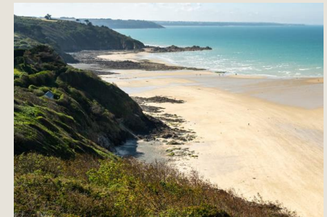
Plage des Rosaires Plérin À 15 minutes