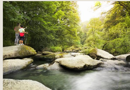
Le Chaos du Gouët St-Julien À 7 minutes