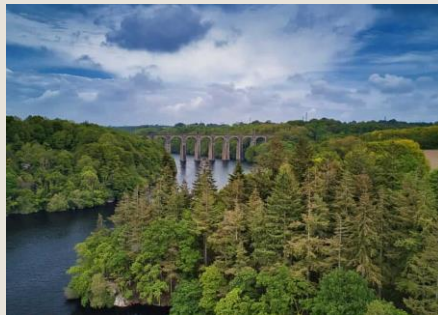
Le lac St-Barthélémy La Méaugon À 5 minutes